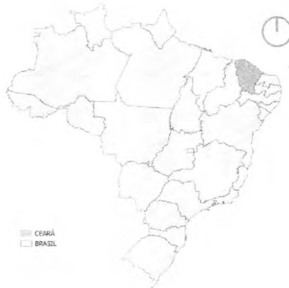
Figura 1 MAPA DE LOCALIZAÇÃO CEARÁ NO BRASIL