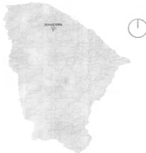
Figura 2 MAPA DE LOCALIZAÇÃO DE IRAUCUBA NO CEARÁ