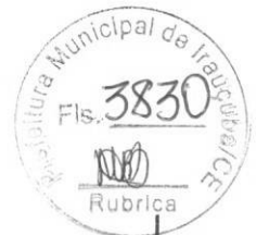
TABELA SINAPI 06/2021 NÃO DESONERADA - SEINFRA 027 - PREFEITURA DE IRAUÇUBA