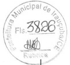
TABELA SINAPI 06/2021 NÃO DESONERADA - SEINFRA 027 - PREFEITURA DE IRAUÇUBA