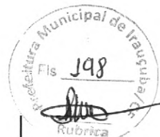
TABELA SINAPI 06/2021 NÃO DESONERADA/PREFEITURA DE IRAUÇUBA