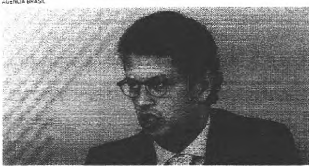
RICARDO Salles se reúne hoje com o Conselho Nacional de Meio Ambiente

Resoluções do Meio Ambiente que protegem áreas de manguezais e restingas que hoje são áreas de proteção ambiental (APAs) de manguezais e de restingas do litoral brasileiro. A revogação dessas regras abre espaço para especulação imobiliária nas faixas de proteção das praias e ocupação de áreas de manguezais para projetos turísticos.