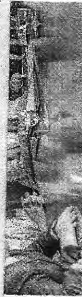
CAMILO E LULA se reuniram ontem em Brasília

O texto da portaria, que já foi assinada pelo ministro, diz que "ficam suspensos os prazos de que tratam os artigos 4º, 5º, 6º e 7º da Portaria nº 521, de 13 de julho de 2021, que