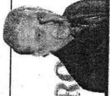
ESTA COLUNA É PUBLICADA DE SEGUNDA A DOMINGO

Para assumir liderança do ranking da Copa do Mundo, o Brasil basta ser vice, pois Alemanha, que é a líder, caiu fora.